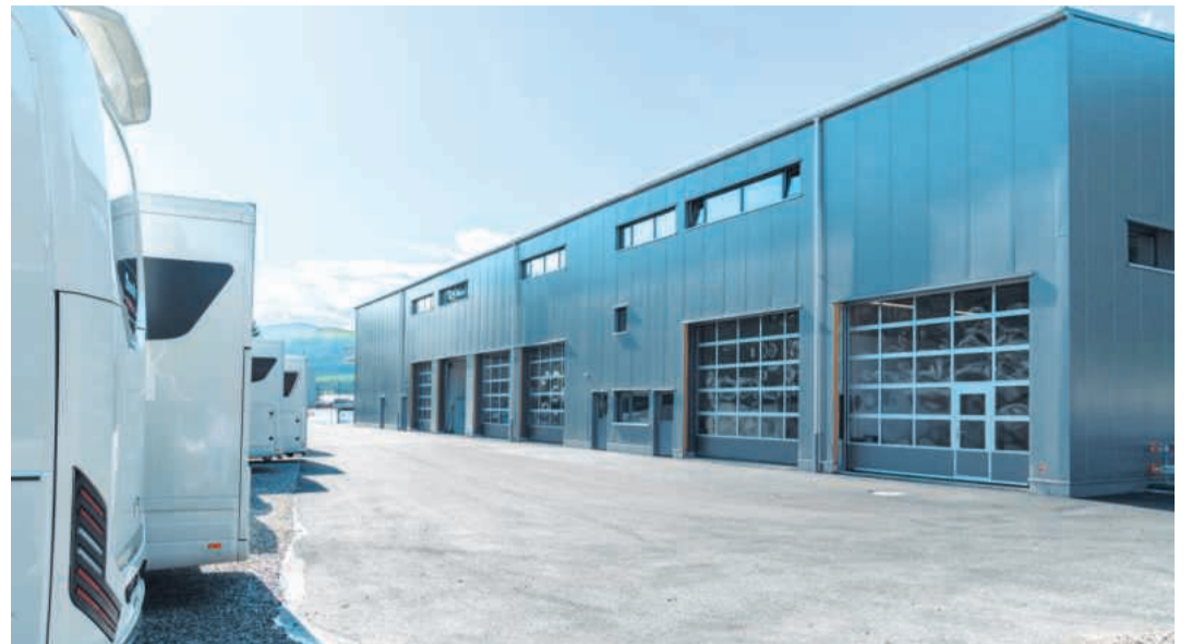
Moderne Werkstatt für Service und Ausbau der Fahrzeuge.