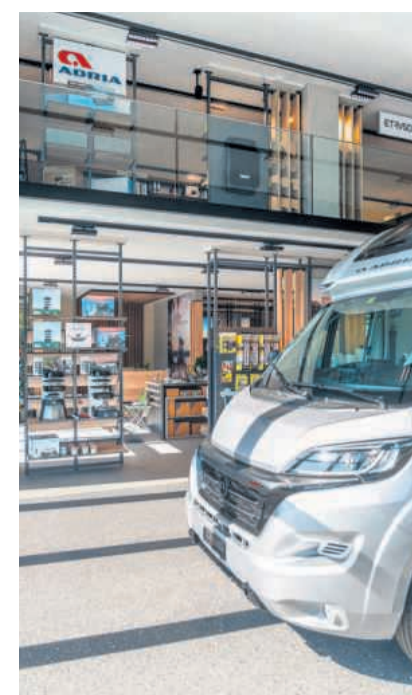
Bereich für die End-Übergabe der Fahrzeuge an die neuen Besitzer.

Im zweiten Stockwerk befindet sich neben einigen Büroräumen eine gemütlich eingerichtete Gäste-Lounge, welche zum Verweilen einlädt. Zwei Arbeitsplätze mit Internet-Anschluss ermöglichen den Kunden, die Wartezeit sinnvoll zu überbrücken. Ausserdem bietet ein grosses Panorama-Fenster Einblick in die moderne Werkstatt.