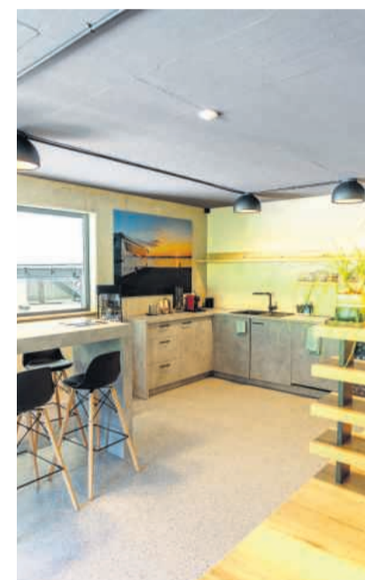
Gemütliche Gäste-Lounge mit Panorama-Fenster zur Werkstatt.