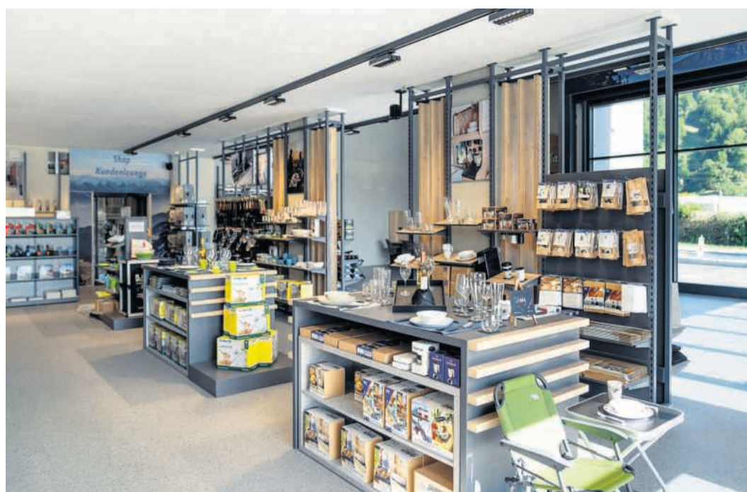
Im Eingangsbereich findet man im grosszügigen Zubehör-Shop alles rund ums Thema Caravan-Reisen.